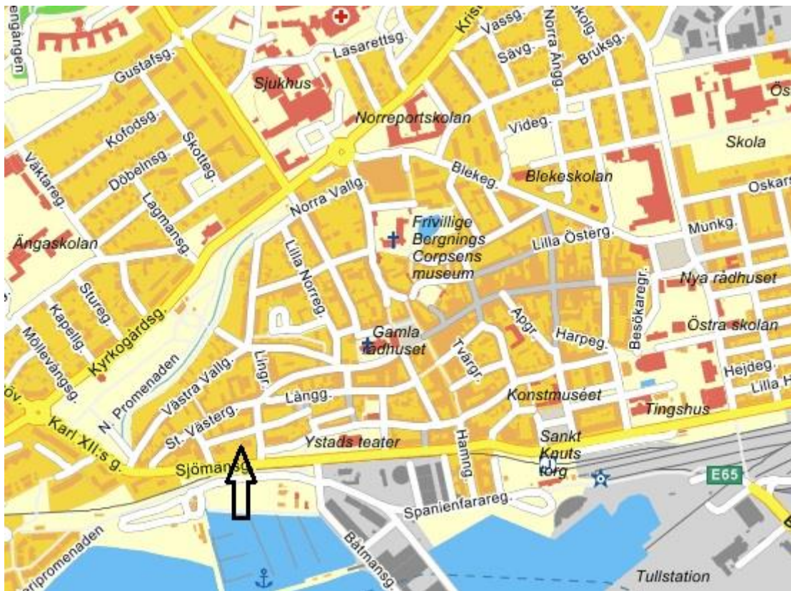
Figur 2. Ystad med platsen för undersökningen inom fastigheten Ybes 1 markerad med en pil.