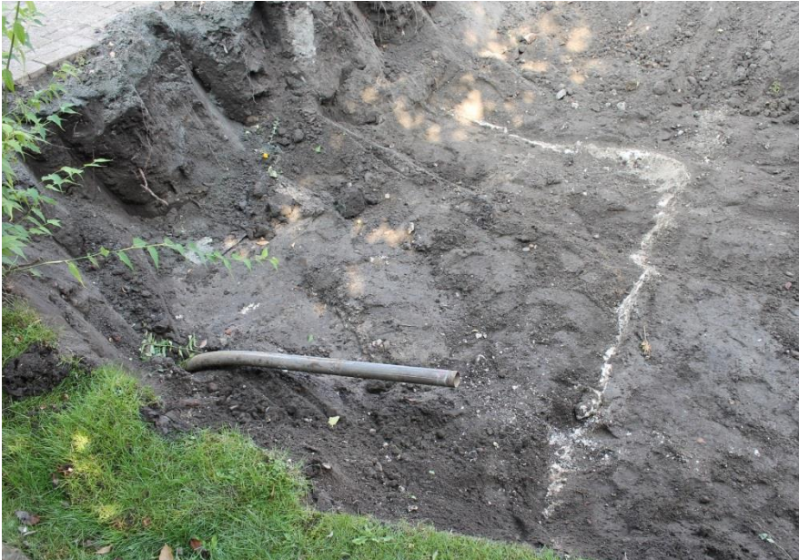
Figur 6. Den östra och norra kanten av en kalkbassäng eller grop inom fastigheten Ybes 1 i Ystad. I det sydvästra hörnet av schaktet fanns ett uppstickande järnrör. Foto mot nordväst.