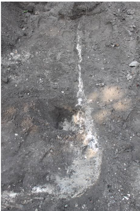
Figur 5. Det nordöstra hörnet av en kalkbassäng eller grop inom fastigheten Ybes 1 i Ystad. På bilden skymtar botten av grop. Foto mot väster.

I övrigt gjordes inga andra arkeologiska iakttagelser i schaktet.