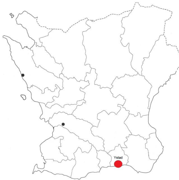
Figur 1. Skåne med platsen för Ystad markerad med en röd prick. På kartan framgår även den gamla häradindelningen.