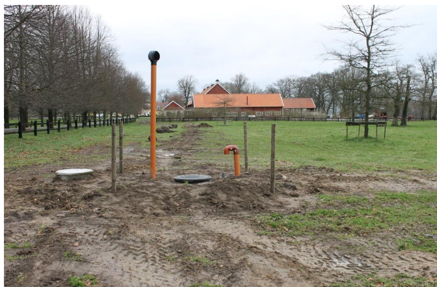
Figur 5. Avloppsschakt i den södra delen av fastigheten Ågerup 2:83. Mellan 20 och 50 meter norr om brunnen fanns en del uppschaktade stora stenar. Foto mot norr.