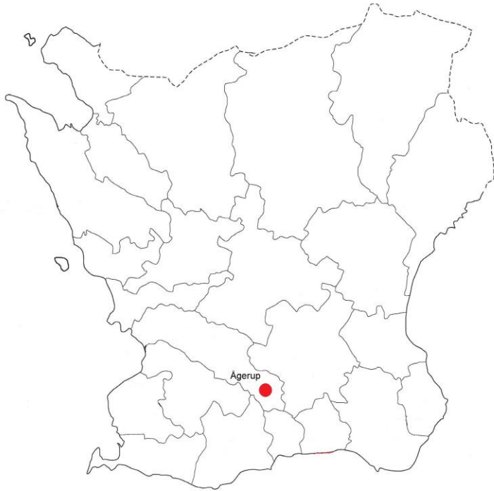
Figur 1. Skåne med platsen för Ågerups Säteri i Torna härad markerad med en röd prick.